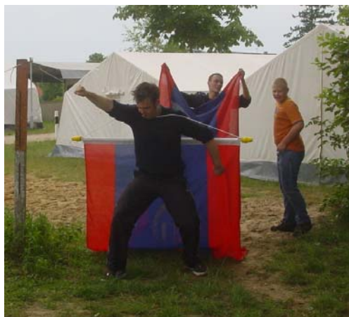
Superfeuerwehrmann greift ein!

Das die JF-Vöhrum einen guten Job gemacht hat, daran können wir uns sicher noch die ganze Woche erfreuen, denn die Fahne soll ja erst am Samstag abgenommen werden.