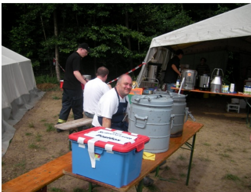
Der Küchenchef & unsere Zeitungsbox im Vordergrund