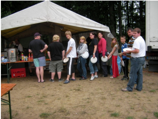
von wegen lange Schlangen