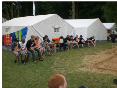
Warten auf den Einsatz beim Völkerball