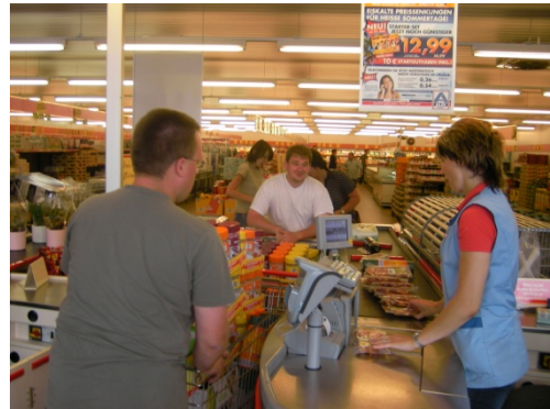
Einkaufen für alle