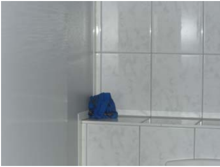
nächstes mal die Unterhose wegräumen