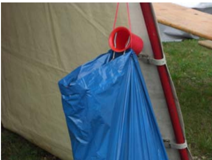
Eigenkreation unseres Zettelkasten