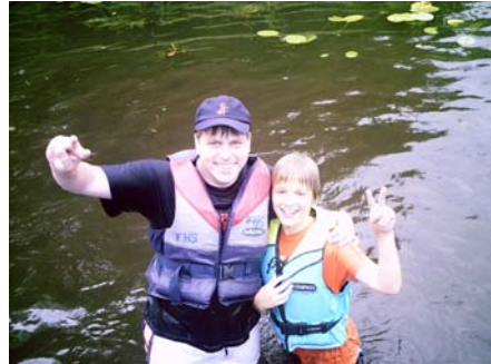
Zweiter beim Schiffeversenken