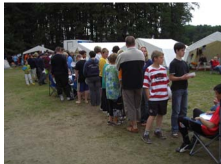
Da sag noch einer es schmeckt nicht! Warten auf 18.30 Uhr